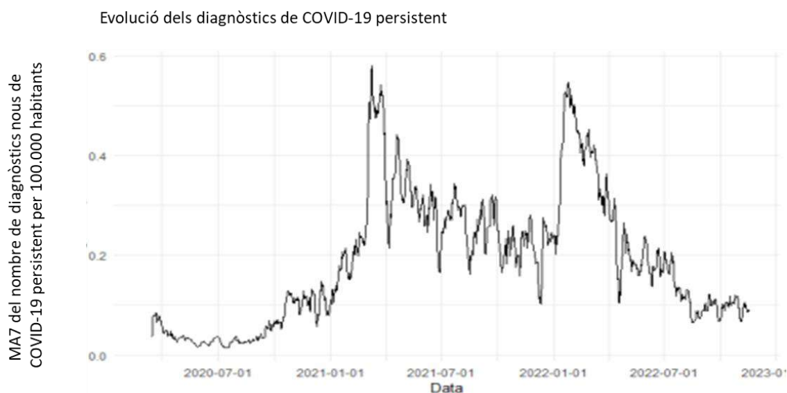
Figura 2. Evolució de la mitjana mòbil de 7 dies (MA7) de la taxa de casos de COVID-19 persistent registrats a l'ECAP per 100.000 habitants

S'observa un gradient segons el nivell socioeconòmic, amb taxes superiors en pacients d'àrees urbanes amb més privació (198,5 per 100.000 habitants) que en els d'àrees rurals o urbanes amb menor privació (168,5). També s'observen diferències importants en la taxa de diagnòstic de COVID-19 persistent entre els diferents equips d'atenció primària, amb alguns que tenen taxes que són més del doble de la mitjana.